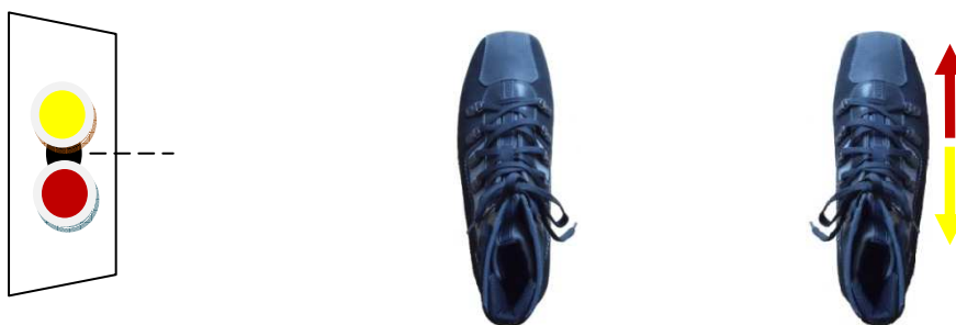
Feineinstellung Seite I*

Stehst du mit der Waffe aber schon in der Neun und dir fehlt nur ein ganz kleines Stück bis in die Mitte der Scheibe, dann ist dieses Steuerrad ungeeignet. Hier bedienst du dich deinem zweiten Steuerfuß.